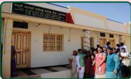
વિંગનો ઉદ્ઘાટન કરતા દાતા પરિવારના સભ્યો