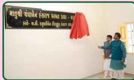
વિવિધલક્ષી હોલનું ઉદ્ઘાટન કરતા દાતાશ્રી અને સ્નેહી