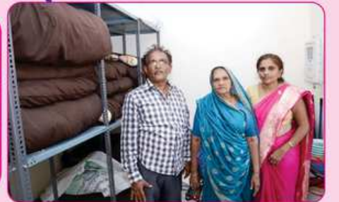
સ્ટોર રૂમ નં. ૨ ના દાતા પરીવાર