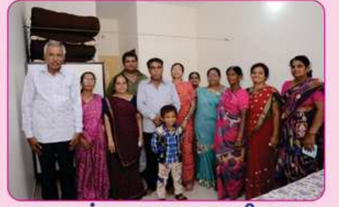
રૂમ નં. ૩ ના દાતા પરીવાર