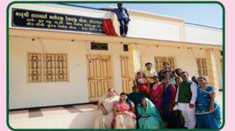
વિંગનો ઉદ્ઘાટન કરતા દાતા પરિવારના સભ્યો