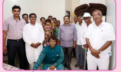
રૂમ નં. ૬ ના દાતા પરીવાર