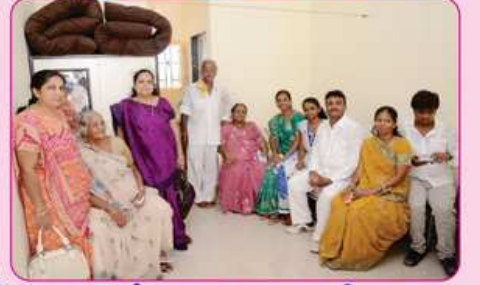
રૂમ નં. ૯ના દાતા પરીવાર