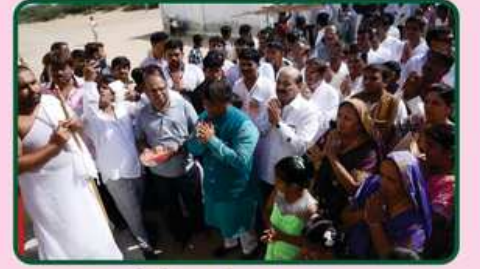
પ. પુ. મોક્ષેસચંદ્રસાગરજી મ.સા. દ્વારા માંગલિક