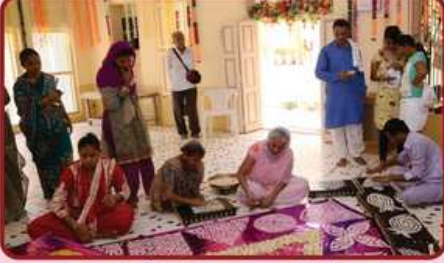
૧૮ અભિષેકની તૈયારી કરતી સખી મંડળની બહેનો