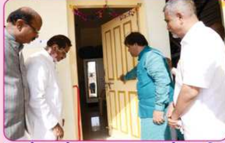
રૂમ નં. ૮નું ઉદ્ઘાટન કરતાં ટ્રસ્ટીઓ