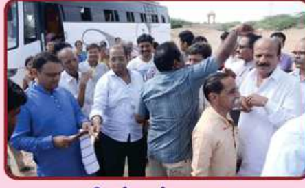
શ્રી સંઘ નું સ્વાગત