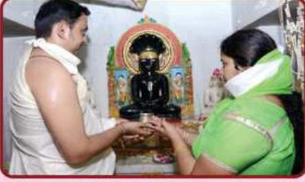
અઢાર અભિષેકના દાતા પરિવાર સભ્ય