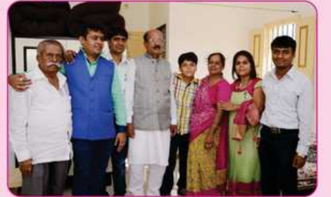
રૂમ નં. ૧૫ના દાતા પરીવાર