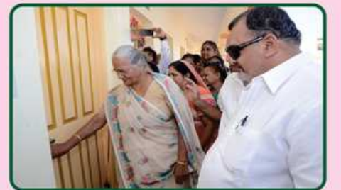
કાર્યાલયનું ઉદ્ઘાટન કરતા દાતા પરિવારના સભ્યો