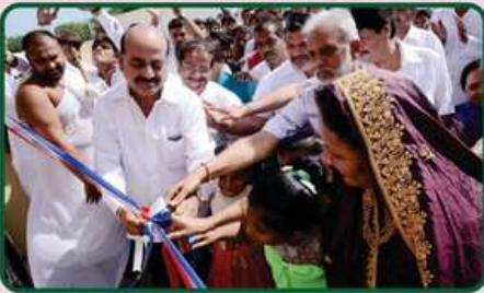
સંકુલનો ઉદ્ઘાટના કરતા દાતા પરિવારના સભ્યો