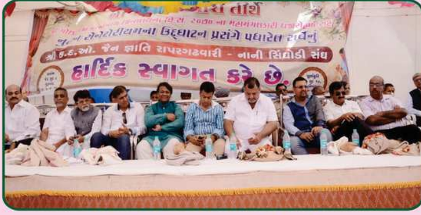
મંચ ઉપર બિરાજમાન અતિથિ વિશેષો