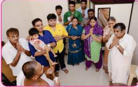
રૂમ નં. ૧૦ ના દાતા પરીવાર