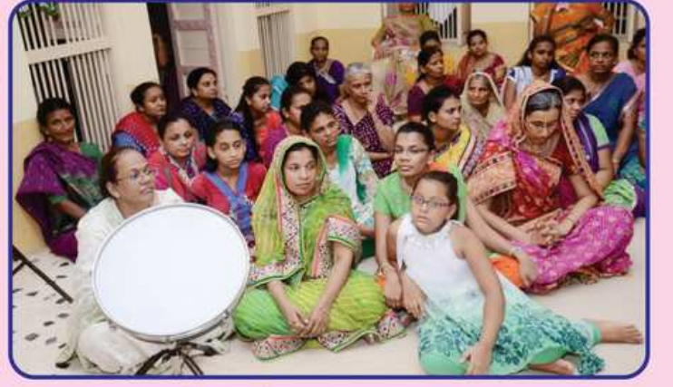
ભાવનાનું આનંદ માણતા શ્રાવક-શ્રાવિકાઓ