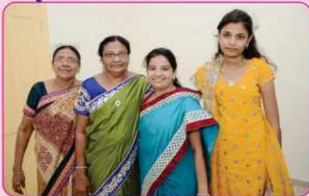
સ્ટોર રૂમ નં. ૧ ના દાતા પરીવાર