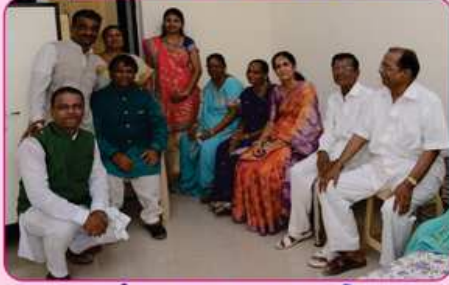
રૂમ નં. ૭ ના દાતા પરીવાર