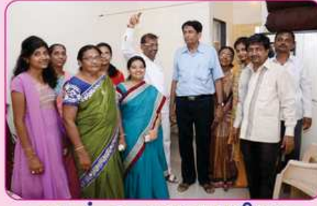
રૂમ નં. ૨ ના દાતા પરીવાર