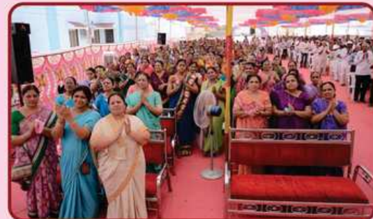
સમારોહમાં ઉપસ્થિત શ્રાવક - શ્રાવિકાઓ