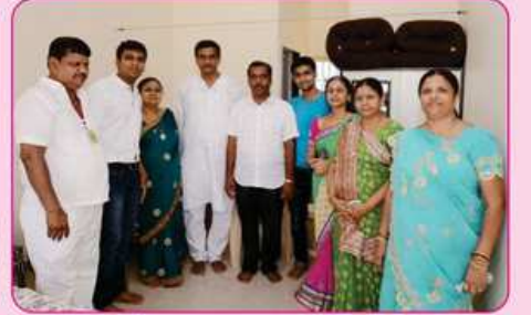
રૂમ નં. ૧૨ના દાતા પરીવાર