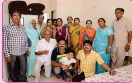
રૂમ નં. ૧૧ ના દાતા પરીવાર