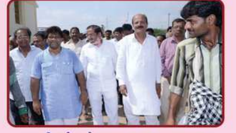
શ્રી સંઘનું ગામ તરફ પ્રયાણ