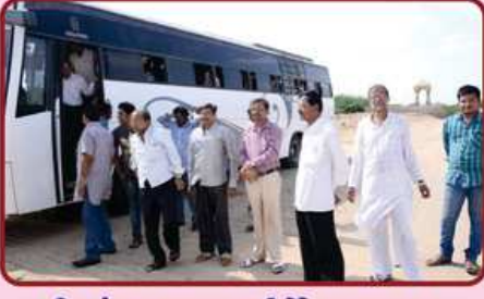
શ્રી સંઘનું રાપર તીર્થે આગમન