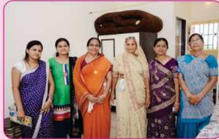
રૂમ નં. ૧૪ ના દાતા પરીવાર