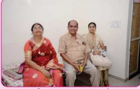
રૂમ નં. ૪ ના દાતા પરીવાર