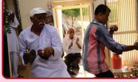
અઢાર અભિષેકમાં ભાવવિભોર ભાવિકો