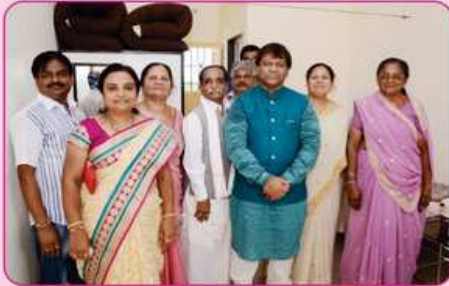
રૂમ નં. ૧૩ ના દાતા પરીવાર