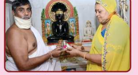
અઢાર અભિષેકના દાતા પરિવાર સભ્ય