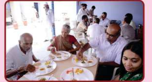
સાધર્મિક ભક્તિનું લાભ લેતા અતિથિઓ