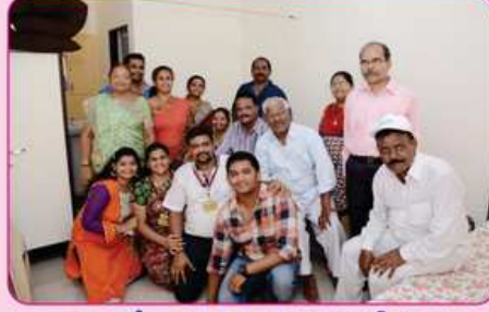
રૂમ નં. ૫ ના દાતા પરીવાર