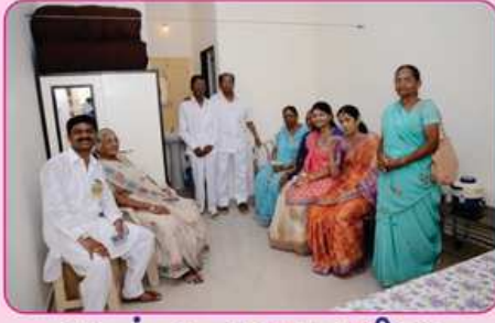
રૂમ નં. ૧ ના દાતા પરીવાર