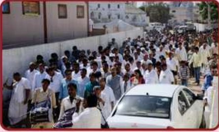
સેનેટોરીયમ ઉદ્ઘાટન તરફ શ્રી સંઘનું પ્રયાણ